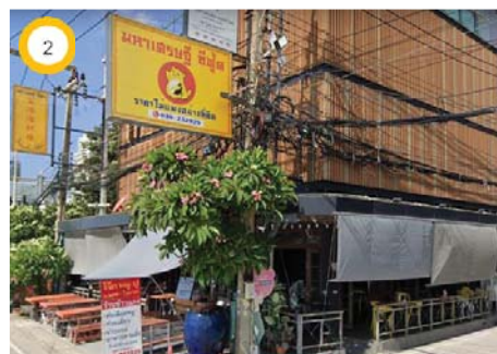
ร้านอาหารมหาเศรษฐีซีฟู้ด