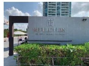
โครงการ Reflection Jomtien Beach Pattaya