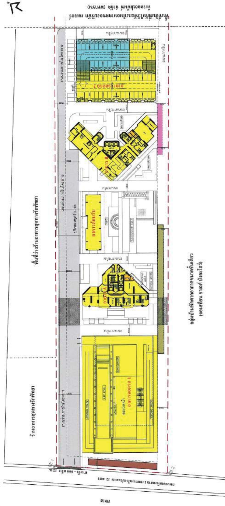
รูปที่ 1-3 แผนผังการใช้ประโยชน์พื้นที่ภายในโครงการ