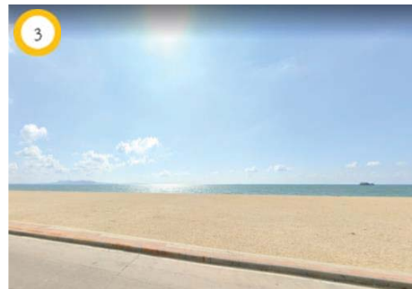
ถนนจอมเทียนสาย 1 และชายฝั่งทะเลอ่าวไทย