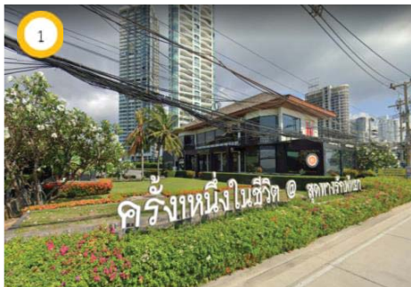
ร้านอาหารสดทางรักพทยา