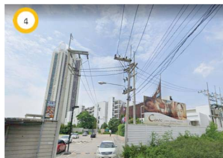
โรงแรม Centra by Centara Maris Resort Jomtien